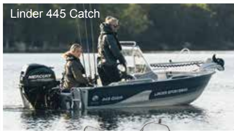
Linder 445 Catch