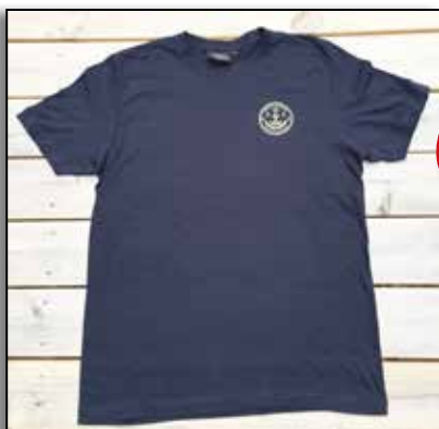
T-shirt Kings 106 Marin med screentryck