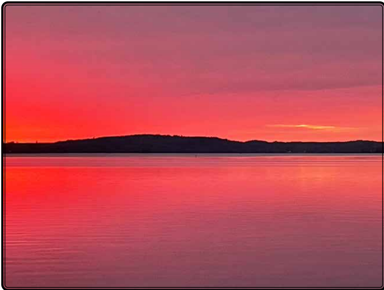
2024-07-09 från HSS fototävling 2024