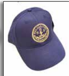
Keps HSS en storlek med brodyr i guld

Storlekar: XXL XL L M Tänk på att storlekarna kan var lite små