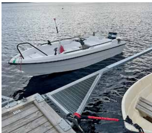
Olovlig förtöjning vid Sydbryggan.