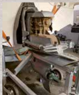
Bälgbyte Volvo Penta sx

Sandsbro Servicehall är inte bara en bilverkstad utan erbjuder också service för din båt, ditt släp och båtmotor. Vi har en mångårig erfarenhet inom båtar och motorer. Vi byter olja, filter och mycket mer enligt dina önskemål. Nu är det hög tid att tänka på service för din motor inför vintern.