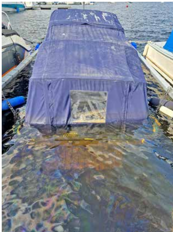
Sjunken båt vid Sydbryggan.

Det stora arbetet som återstår inom Hamnsektionen är att reparera landgången till Sydbryggan. Under sommaren har även den yttre bocken som håller landgången börjat ge vika och en reparation planeras till slutet av sommaren då vi hoppas att många frivilliga kan ställa upp.