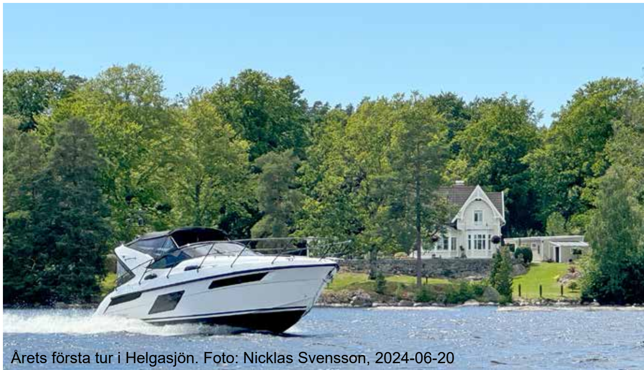
Årets första tur i Helgasjön.